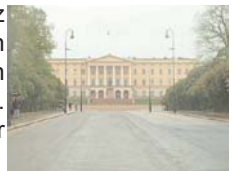
Palast in Oslo

Trotzdem trifft der Vorfall einen wunden Punkt der Königsfamilie: Norwegens Kronprinzessin Mette-Marit hatte vor ihrer Heirat mit Kronprinz Haakon eine Liaison mit einem verurteilten Drogenkriminellen. Haakons Schwester Märtha Louise wiederum ist mit dem Schriftsteller und Filmemacher Ari Behn verheiratet, der bereits in Las Vegas in Begleitung zweier Kokain schnupfender Prostituiertes gesehen worden war.